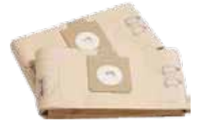
Kağıt Torba (Opsiyonel)