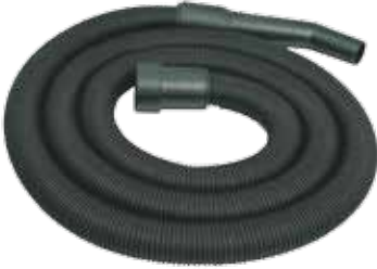
Hortum 35 mm