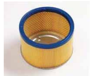
Kartuş Filtre (Opsiyonel)